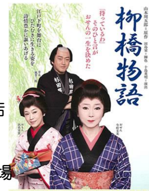
2017年8月31日(木)~9月5日(火) 大塚日本橋 国立文楽劇場 ●柳橋物語(全3回) 午公演 13時開演 14時30分閉演 ●柳橋物語(全3回) 夜公演 18時開演 20時30分閉演 ●柳橋物語(全3回) 大塚公演 18時開演 20時30分閉演

前進座の舞台を見に行きませんか? 最終日の公演で、役者さんとの食事会も楽しめます。 集合:和もーど成田店 時間:AM9:30 現地集合も可です。 会場:日本橋三越劇場 観劇料金:6,500円 (通常7,500円)